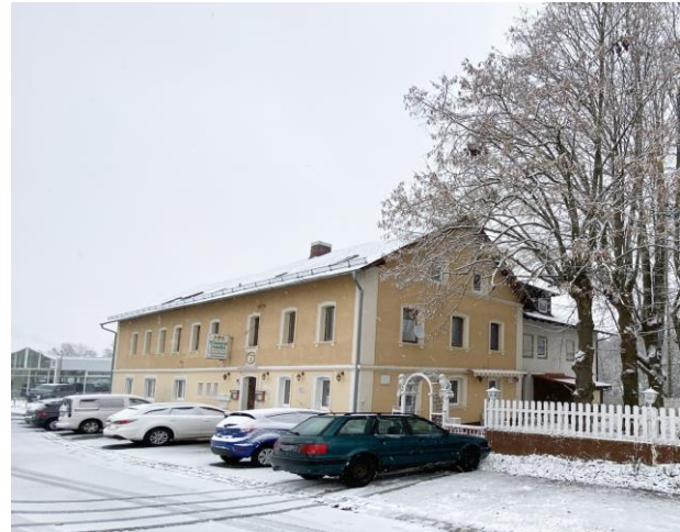
Energieausweis in Bearbeitung

Obj.-Nr.: 000003365 Objekt: Gaststätte Wolfsbacher Str. 3 95448 Bayreuth Baujahr: 1880, Anbau 1992 Gastronomiefläche: ca. 145 m 2 Nutzfläche EG: ca. 100 m 2 Nutzfläche UG: ca. 100 m 2 Biergarten: ca. 170 m 2 Gesamtfläche: ca. 515 m 2 Bezugsfrei: nach Absprache